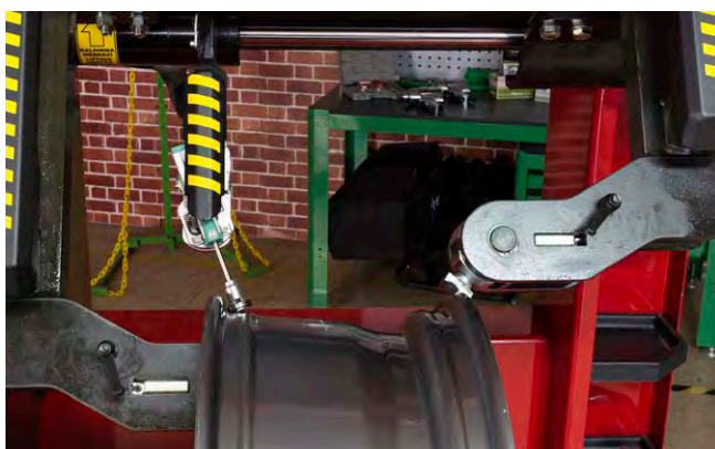
Måling i sanntid når man jobber på felgen.