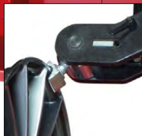
Kraftig justerbart sidestøtte/verktøy