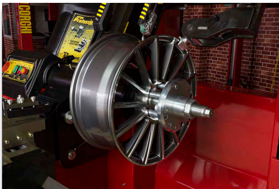
Enkel og kraftig oppspenning