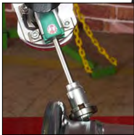
Måleprobe 2 akser

Maskinen måler automatisk i to akser samtidig, jobbing i sanntid gjør dette til en enkel maskin å bruke. Alt styres via et enkelt panel med joystick, kraftig infrarød varmeenhet brukes for å varme opp felgen. Maskinen er solid med sine 940kg og er med dette tungvekteren i klassen.